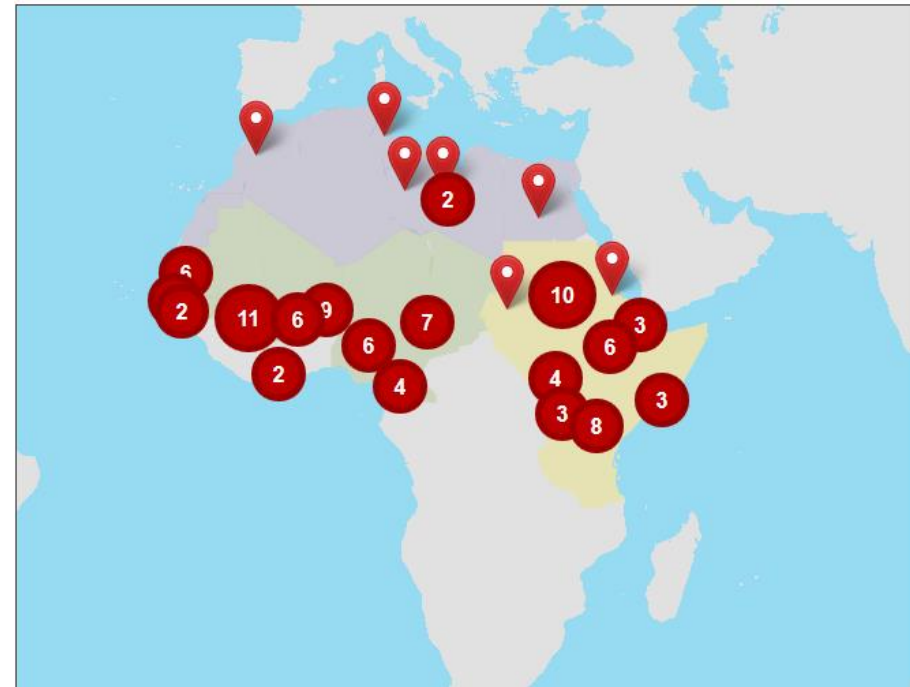
The EU Emergency Trust Fund for Africa